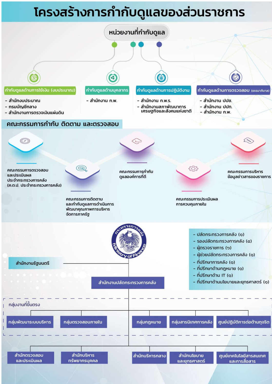
รูปภาพ แสดงภาพโครงสร้างของสำนักงานปลัดกระทรวงการคลังและระบบการกำกับดูแลองค์การ